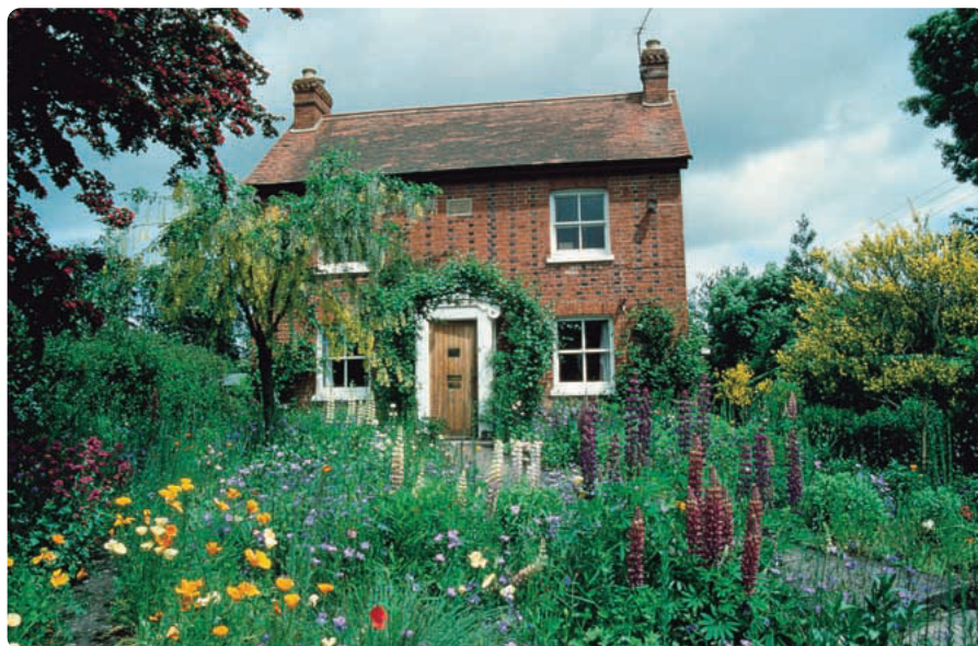
Dr. Edward Bach Centre, Mount Vernon - Oxfordshire, Inghilterra.

In questa casa il Dr. Bach visse e lavorò negli ultimi anni della sua vita.