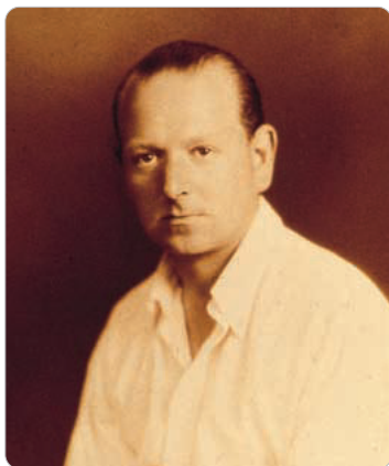
Dr. Edward Bach (1866-1936)

D'altra parte osserviamo il sorgere ed il proliferare di pratiche che consegnano