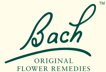
Logo Bach Original Flower Remedies

“Il compito dei genitori è essenzialmente il privilegio di permettere ad un'anima di entrare in contatto con il mondo al fine di evolversi... I genitori devono sforzarsi di dare orientamento spirituale, mentale e fisico al nuovo venuto, senza tuttavia scorda-