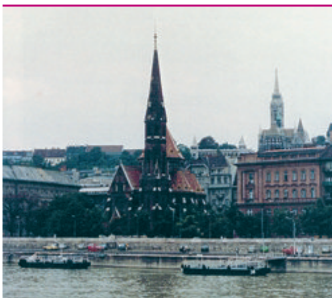
Scorcio del Danubio in Ungheria.

Claudio Magris nel libro “Danubio”, Garzanti editore.